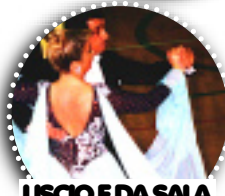
LISCIO E DA SALA