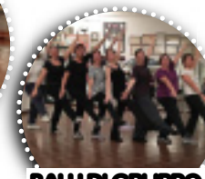
BALLI DI GRUPPO